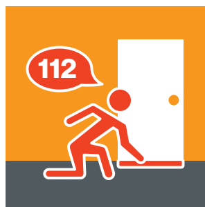
Tür mit feuchtem Tuch abdichten, Feuerwehr rufen.