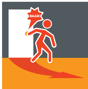
Zimmer- oder Wohnungstür hinter sich schließen.