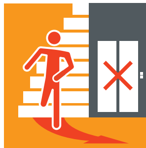
Wohnhaus verlassen. Fahrstuhl nicht benutzen.