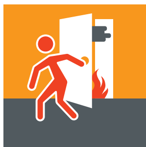
Zimmer- oder Wohnungstür sofort schließen.