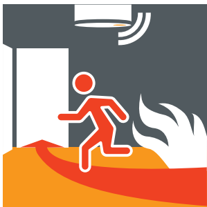
Zimmer bzw. Wohnung umgehend verlassen.