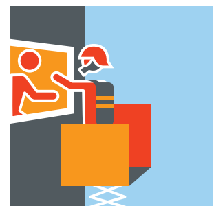
Am Fenster / Balkon zur Straße auf Feuerwehr warten.